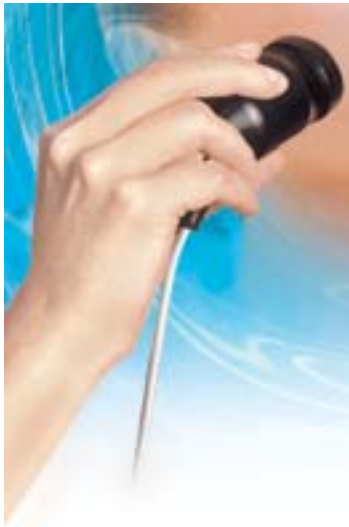
Ultraschall bringt unbewegliche Wirkstoffe auf Trab

bes und dessen Dicke ab. Aufgrund ihrer spezifischen Dichte absorbieren die verschiedenen Gewebetypen den Ultraschall unterschiedlich gut (s. Kap. Ultraschallintensität). Dementsprechend unterschiedlich sind auch die Temperaturen in den einzelnen Gewebearten. Weil die Haut und das Unterhautfettgewebe den Ultraschall nur geringfügig absorbieren, tiefere Gewebeschichten, insbesondere bindegewebsartige Strukturen und Knochen, jedoch deutlich besser, kommt es zu einer besonderen Erwärmung und damit Tiefenwirkung des Ultraschalls an den Grenzflächen dieser Gewebe. Aus der thermischen Wirkung resultiert in erster Linie eine Blutgefäßerweiterung; dies führt im Endeffekt dazu, dass die beschallten Bereiche verstärkt durchblutet werden.